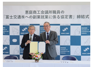
恵庭商工会議所職員の「富士交通㈱への副業就業に係る協定書」締結式

北海道日本ハムファイターズ 2軍新ファーム施設誘致 ファイターズを 恵庭に！ 決起会・応援宣言 4月6日、恵庭市日本ハムファイターズ新ファーム施設誘致「決起会」を開催しました。当日は、「ファイターズ新ファーム恵庭構想」を恵庭市長へ説明したほか、恵庭商工会議所による「企業等連携宣言」、市内スポーツ少年団の子どもたちによる「合同応援宣言」が行われ、地域が一丸となって誘致を応援する想いを発信しました。 リアル野球盤大会 Eスコンバスツアー開催！ 誘致に向けた機運を高めるため、さまざまな交流イベントを実施しました。5月23日には福祉屋内運動広場でリアル野球盤大会を開催し、約60名が参加しました。特別ルールによるゲームで、子供から大人まで楽しく交流を深めながら、誘致実現に想いを込めました。さらに、6月30日には北海道日本ハムファイターズ応援バスツアー(会議所会員事業)を実施し、約50名が参加。参加者全員で球場の熱気を感じながら、ファイターズへ熱い声援を送りました。