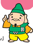
恵庭商工会議所 オリジナルキャラクター「えびすくん」

議員総会とは？ 会員事業所の中から選任された80名の議員が商工会議所の事業について話し合う場だよ。