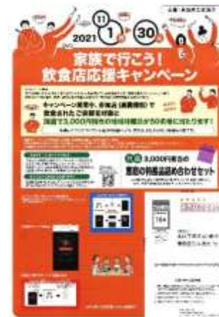
■ 家族で行こう 飲食店応援キャンペーン