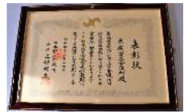
■財政基盤強化表彰

地元企業のIT導入による生産性向上並びに業務効率化を支援するため、より専門的で最新の情報提供が可能となることから、多種多様なシステムを提供する(株)ミロク情報サービスとパートナー契約を締結しました。