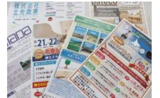
■ チラシデータ作成サービス事業