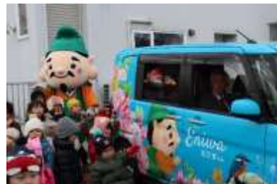
■えびすくんラッピングカー完成

市内で開催されるイベント等で集客・宣伝のツールとして、また子供たちに地域への愛着や興味を抱いて欲しいとの思いを込めラッピングカーを製作しました。恵庭のイメージを発信する広告塔として活用していきます。