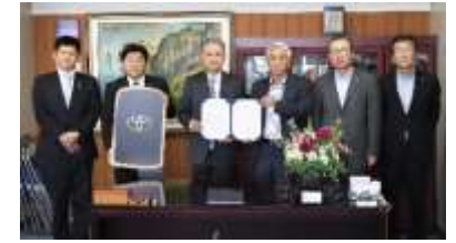
■札幌トヨタ自動車(株)と災害時電力供給協定締結

恵庭商工会議所と札幌トヨタ自動車株式会社は災害時における地域商工業者への支援体制強化を目的として、次世代自動車等の貸与による電力供給に関する協定を締結しました。