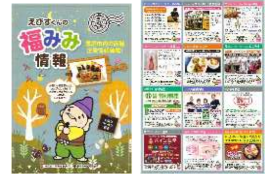
■ 福みみ情報誌・飛翔発行