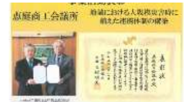
■日本商工会議所事業活動表彰

頻発している自然災害に備え、地域住民の安全安心及び、災害復旧に関する情報を発信するためFMe-niwaと災害時連携協定を結んだ他、災害時に次世代自動車等の貸与を受け、商工会議所の電力を確保することで、支援体制を整えることを目的に、札幌トヨタ自動車(株)恵庭店と電力供給に関する災害協定を締結しました。この取り組みが先進的な事業と評価され日本商工会議所事業活動表彰を受賞致しました。また、財政基盤強化に関し顕著な業績を挙げたとして表彰された他、コロナワクチンの共同接種に対しても表彰されました。