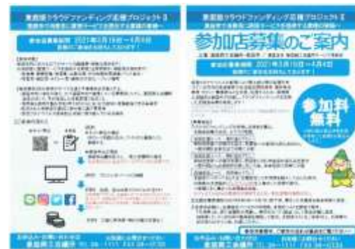
■ 第2弾クラウドファンディング