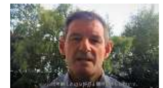
■ ティマル市長のメッセージ

☑ 国際交流事業 令和4年3月恵庭NZ協会の例会が開催されました。現在新型コロナウイルスの影響により、青少年国際交流派遣事業の中止が続いておりましたが、NZティマル市とオンラインで接続し会員との交流を実施。当日は、 2019年にNZティマル市長に就任したナイジェル・ボーウェン市長 よりビデオメッセージを頂いた他、両市より近況報告などの交流を行いました。