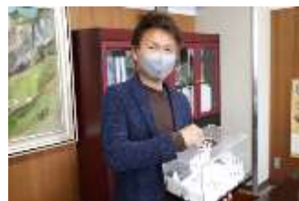
■ 家族で行こうキャンペーン抽選及び地域特産品