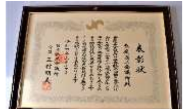
■コロナワクチン共同接種表彰

令和3年6月の暴風雨、令和4年1月の大雪に係る災害情報を、e-niwa 災害情報ツイッターのリンクを添付して当所のLINE登録者に情報提供。e-niwa ツイッターの表示回数が大幅に上昇したとの事で、多くの方が、情報を求めてアクセスしたと推察されます。引き続き皆様に有用な情報提供に努めます。