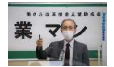
■営業マンセミナー

会員事業所や市内商工業者からコロナ関連の各種支援金等の相談について窓口等1,225件、巡回233件にサポートを行いました。（3月31日現在）